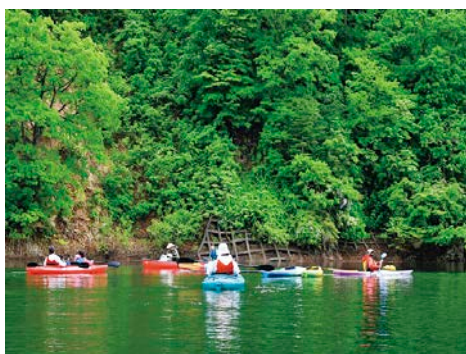
小雨の中、カヌーをこぎながらごみ拾いを行う参加者

協力隊インスタグラムのフォロワー数が450人を超えました。最近では「懐かしいです」「今年こそは伺いたいです」「アンテナショップに行きました！」などと投稿へのコメントもいただいております。田んぼに水が入り、田植えも終わり、絶景の時となりました。時に展望台に上り、飯豊町の癒しの風景を発信していきたいと思っております。